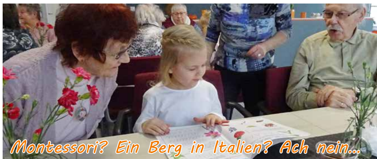
Montessori? Ein Berg in Italien? Ach nein...

men Sie einen rund halbstündigen Vortrag, der in 19 Teile gegliedert ist. Eine super Idee für einen geschichtsträchtigen Spaziergang (9 km) durch Guben und Gubin. Passend dazu hat der Marketing und Tourismus Guben e. V. (MuT) eine Broschüre entwickelt, die den Audioguide mit Bildern und weiteren Informationen ergänzt. Die Broschüre können Sie über die Homepage des MuT downloaden.