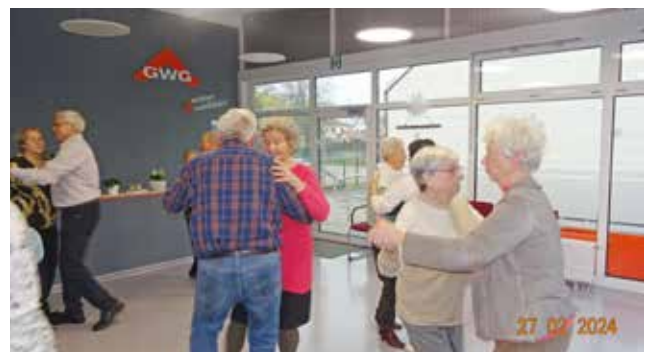
Tanzstunde für Senioren