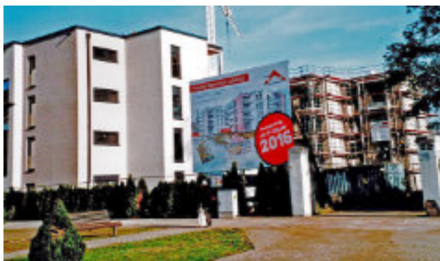
Neubauten in der Berliner Straße, 2016