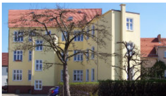
Vorher und nachher: Modernisierung in den 1990er Jahre in der Wilkestraße