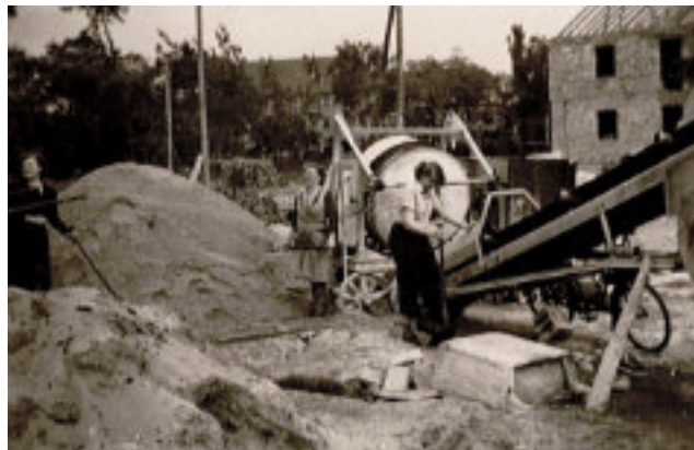
Beginn der Arbeiten am Birkenweg 1955

Klar – aber kein bisschen müde! Wir sind gemeinsam gewachsen, haben viel bewegt – und sind bereit für das, was kommt. Darauf können wir alle richtig stolz sein!